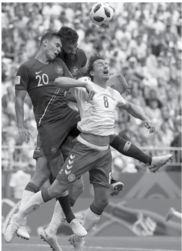
Dinamarca e Austrália fizeram um jogo muito equilibrado