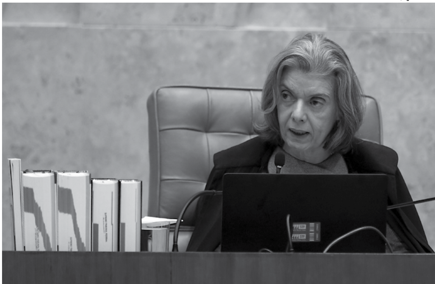
A presidente do Supremo Tribunal Federal, Cármen Lúcia, recebeu relatório final da PF sobre as investigações contra os ministros da Corte

Os áudios foram entregues pelos executivos, aparentemente por descuido dos advogados, à Procuradoria-Geral da República (PGR) em 31 de agosto, em meio a milhares de arquivos que integravam a delação. O teor das gravações levou o então procurador-geral da