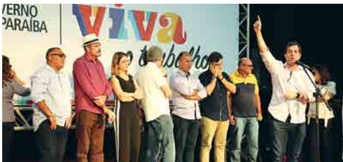
Representantes dos municípios beneficiados estiveram presentes à solenidade que aconteceu em Cajazeiras