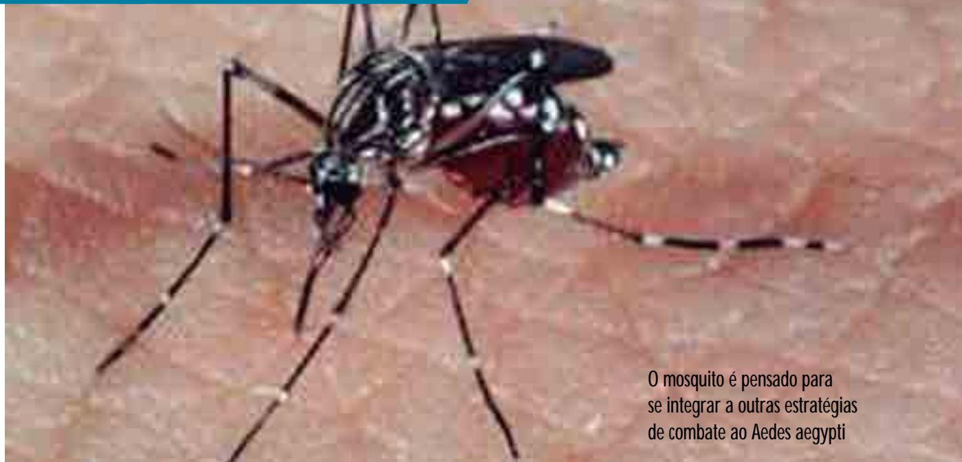
O mosquito é pensado para se integrar a outras estratégias de combate ao Aedes aegypti