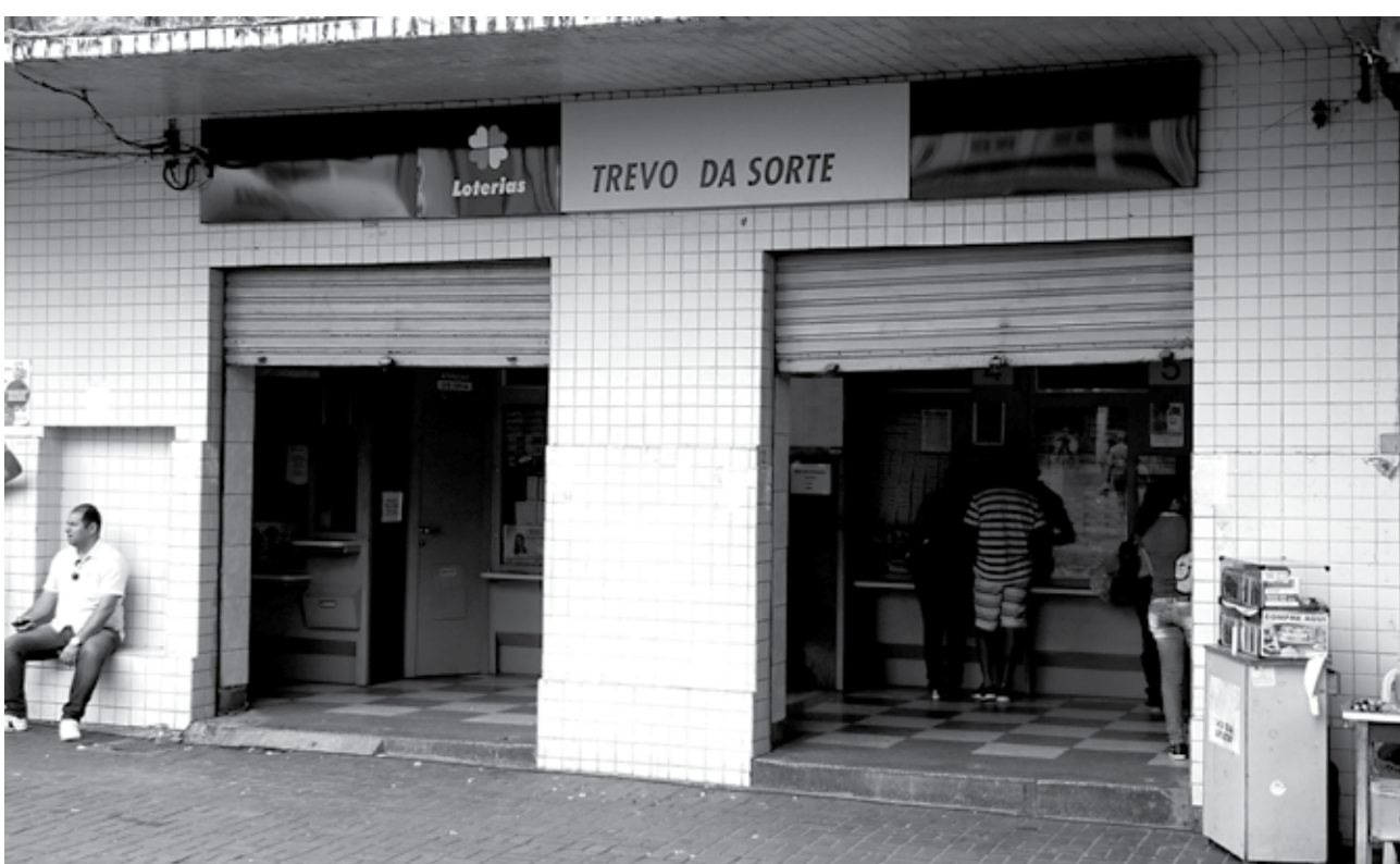
Casas lotéricas na Paraíba vão funcionar de acordo com o expediente comercial. Empresários reforçam atendimento ao público