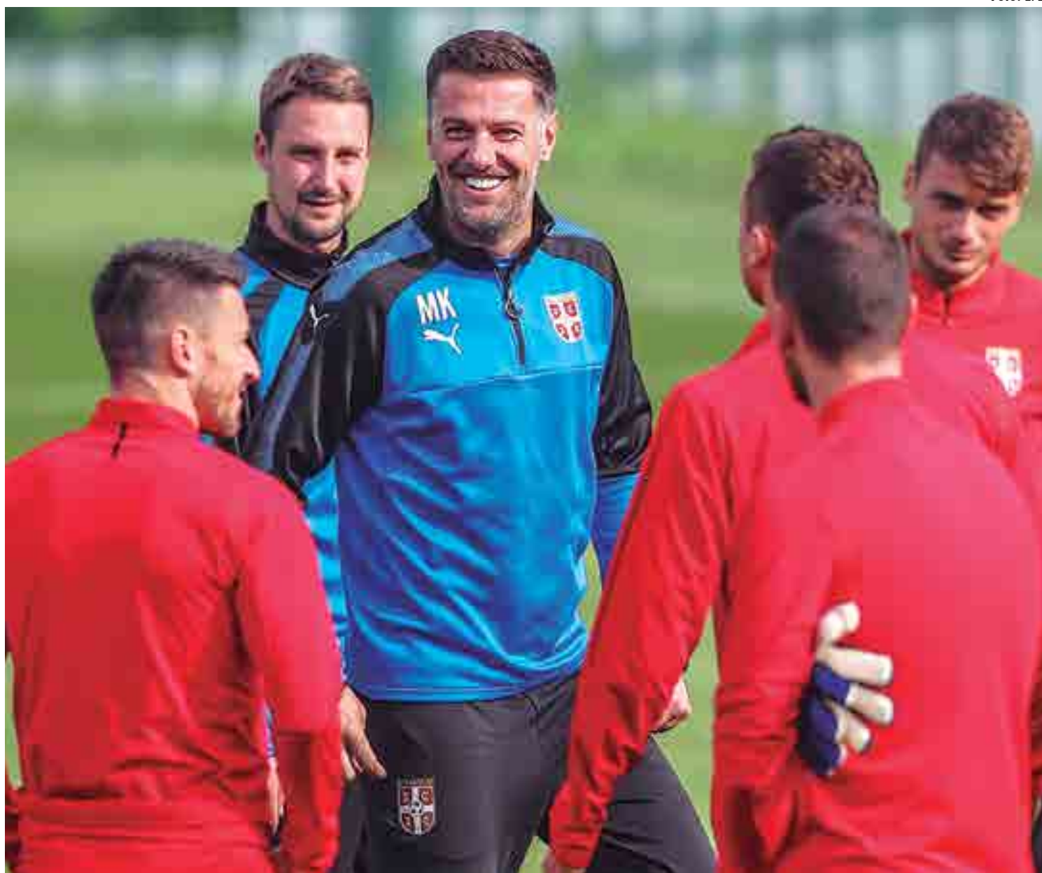
O técnico Mladen Krstajic (C) se descontrai com os jogadores antes do início das atividades de ontem, preparatórias para o jogo decisivo de hoje

Na Sérvia, Mladen Krstajic seguirá a máxima de que "em time que está ganhando não se mexe". Já Petkovic corre o risco de ter de fazer uma troca, porque o volante Valon Behrami sofreu uma sobrecarga muscular na coxa direita e ainda é dúvida para o duelo.