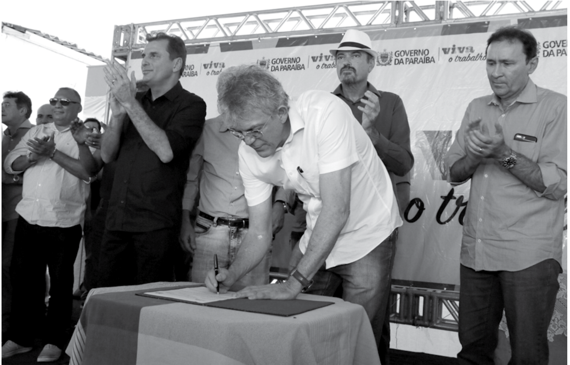
Além de obras e outros benefícios à população de São José de Piranhas, o governador Ricardo Coutinho assinou a ordem de serviço autorizando a revitalização da Travessia Urbana do município

“Os seis sistemas de abastecimento de água que entregamos hoje são muito relevantes para os moradores dessas comunidades,