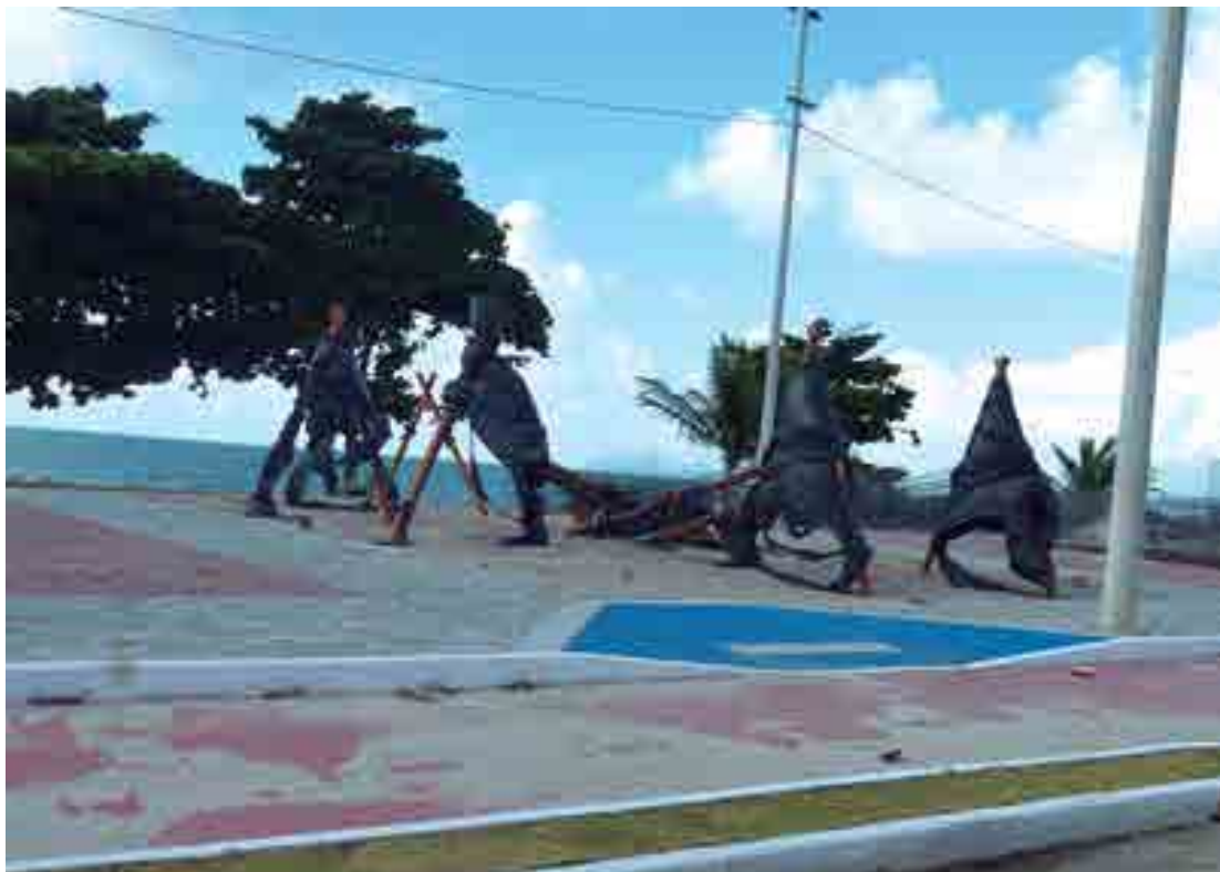
A Praça do Mar de Jacumã está sendo revitalizada pela Suplan, em parceria com a Prefeitura Municipal de Conde