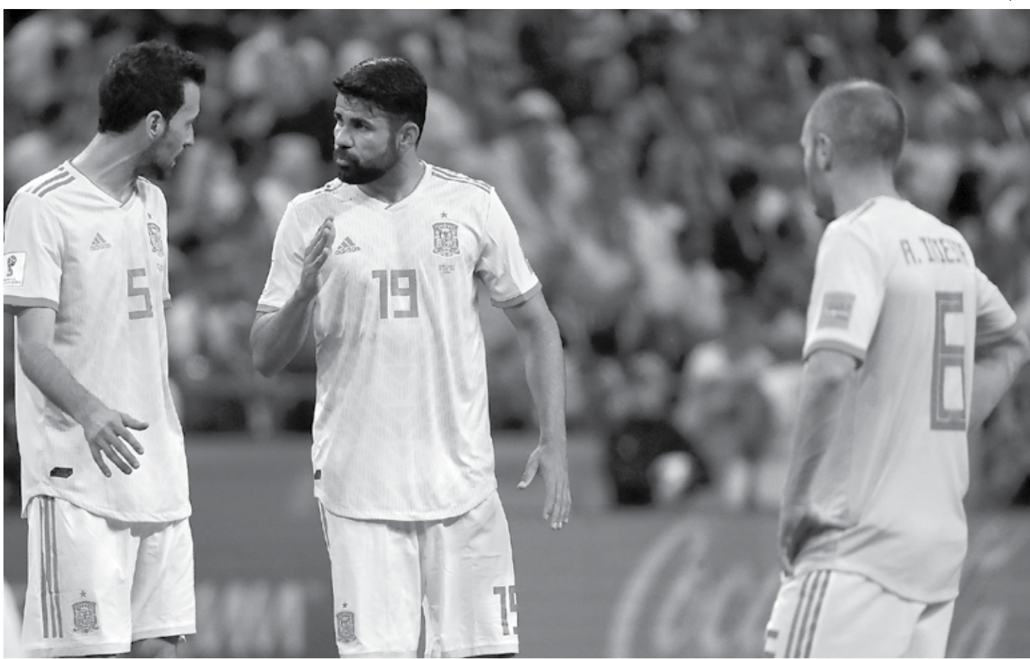
Diego Costa (C) já marcou três gols decisivos pela seleção espanhola, o que deixa a campeã de 2010 em boa situação para garantir a classificação

"Tínhamos que ter paciência porque sabíamos a abordagem que os iranianos fariam, já que o empate era, de certa maneira, muito favorável a eles. Sabíamos que eles iam se fechar atrás e que nós teríamos poucas oportunidades, que deveriam ser aproveitadas", acrescentou