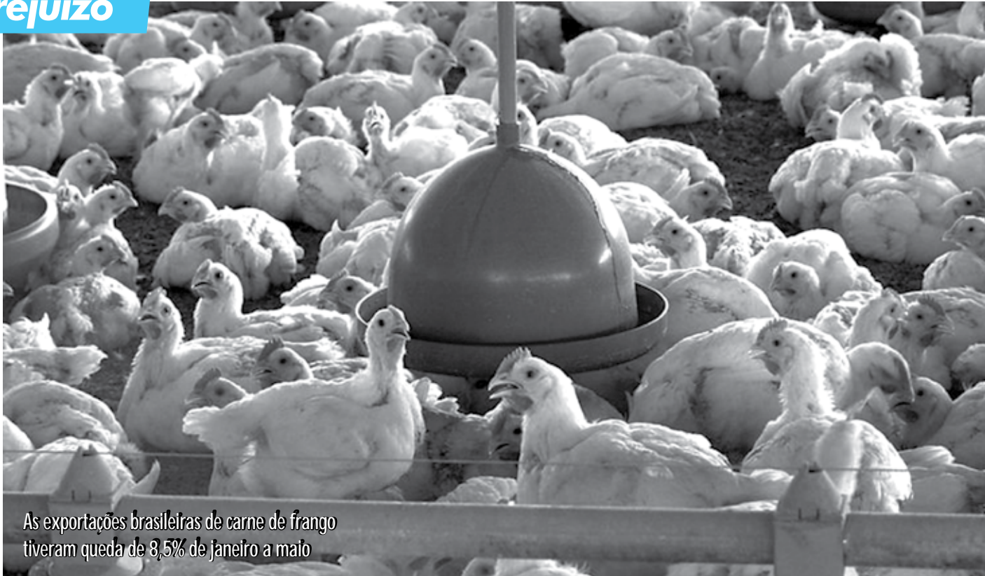
As exportações brasileiras de carne de frango tiveram queda de 8,5% de janeiro a maio