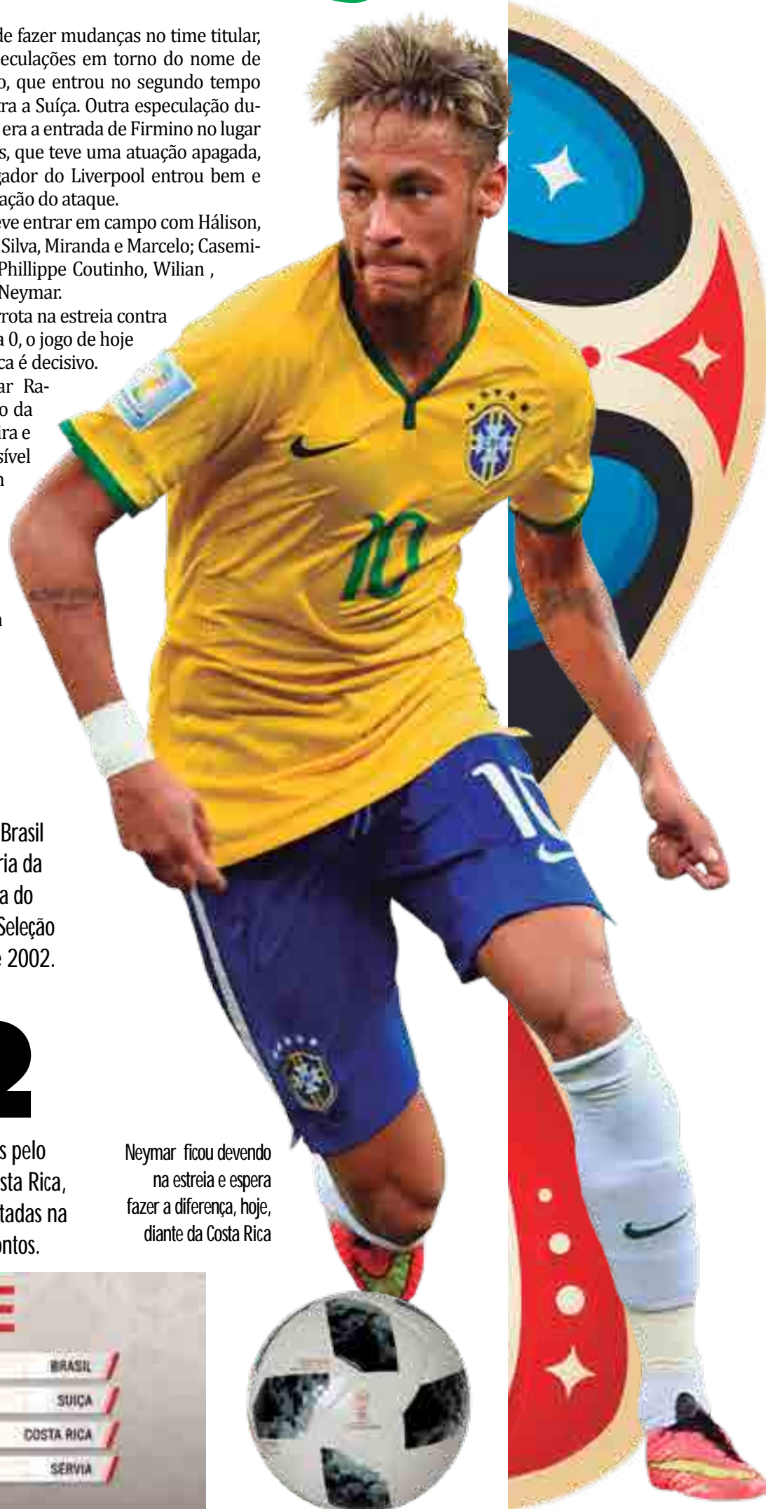
Neymar ficou devendo na estreia e espera fazer a diferença, hoje, diante da Costa Rica

O técnico Óscar Ramírez viu o jogo da Seleção Brasileira e acha que é possível explorar bem algumas falhas do time brasileiro. Ele não pretende mudar o esquema, nem a equipe titular.