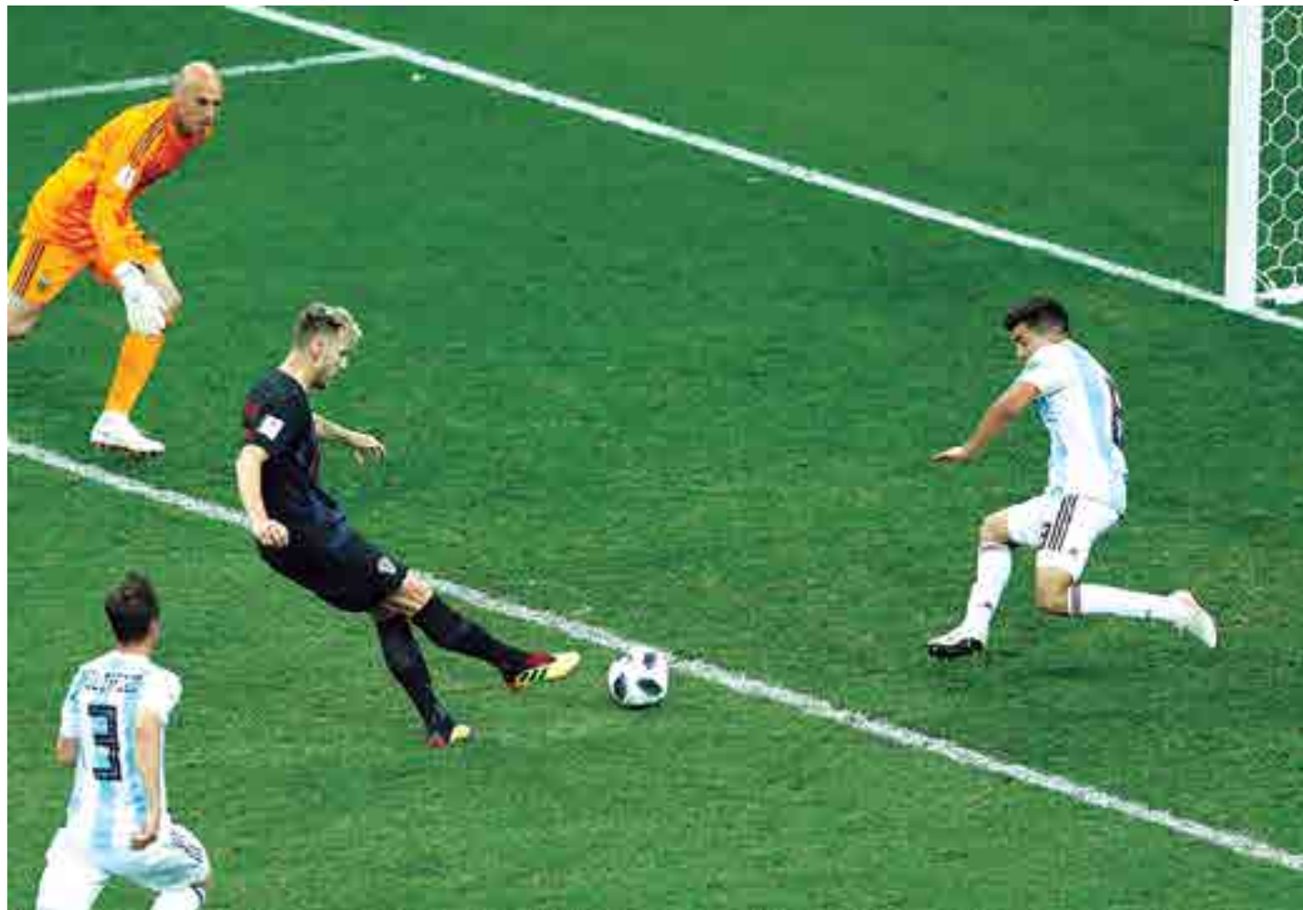
Croatas não tomam conhecimento dos argentinos e vencem o duelo de ontem por 3 a 0, garantindo vaga para as oitavas de final pela primeira vez desde 1988