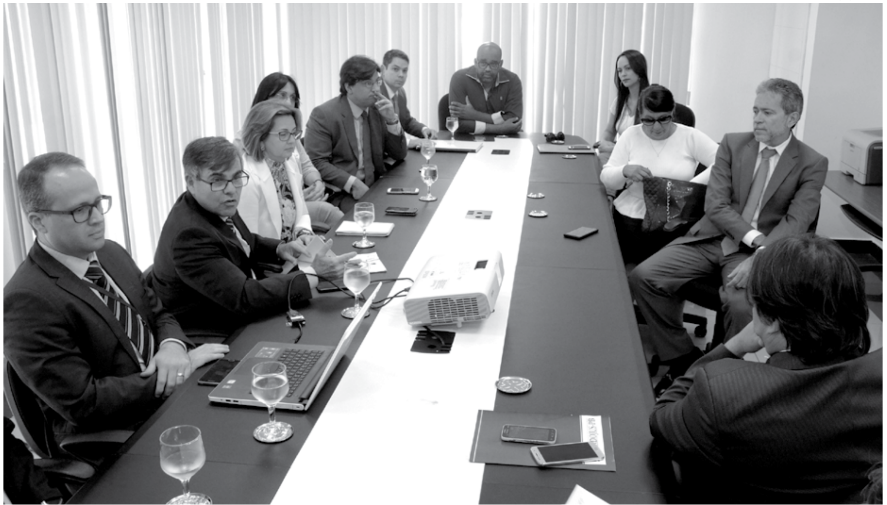
Representantes de vários sindicatos e associações representativos dos serventuários procuraram a presidência do Tribunal de Justiça e cobraram a retomada das negociações